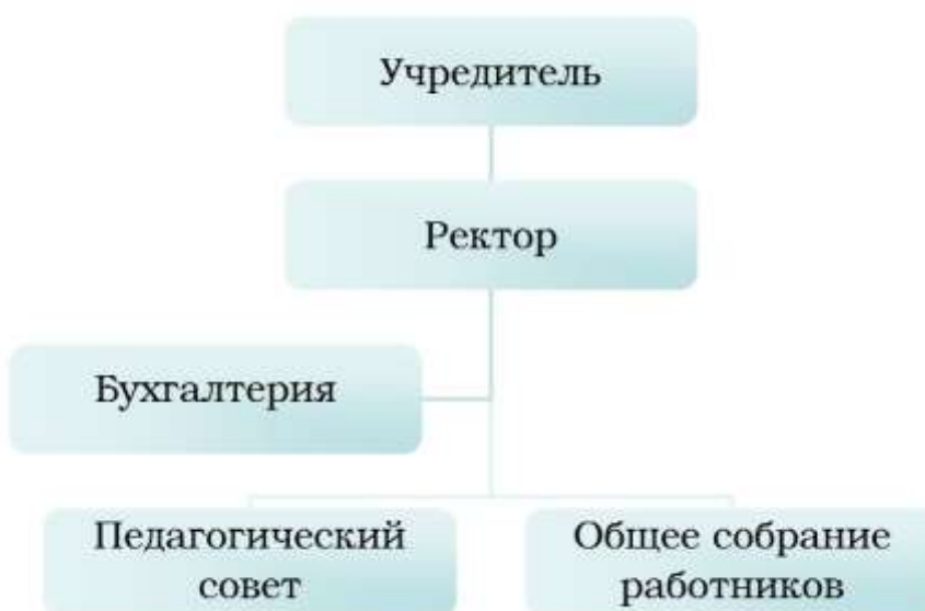
Рисунок 1. Организация управлением Институтом.

В 2021 году на основании требования пункта 4 статьи 26 Федерального закона № 273-ФЗ от 29.12.2012 «Об образовании в Российской Федерации», пунктов 5.8. Устава были сформированы коллегиальные органы управления: Общее собрание работников и Педагогический совет.