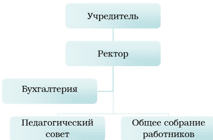
Рисунок 1. Организация управлением Институтом.

В 2021 году на основании требования пункта 4 статьи 26 Федерального закона № 273-ФЗ от 29.12.2012 «Об образовании в Российской Федерации», пунктов 5.8. Устава были сформированы коллегиальные органы управления: Общее собрание работников и Педагогический совет.